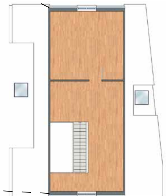
2. Dachgeschoss Wohnung 24