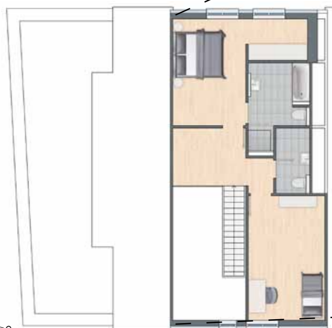
2. Dachgeschoss Wohnung 27